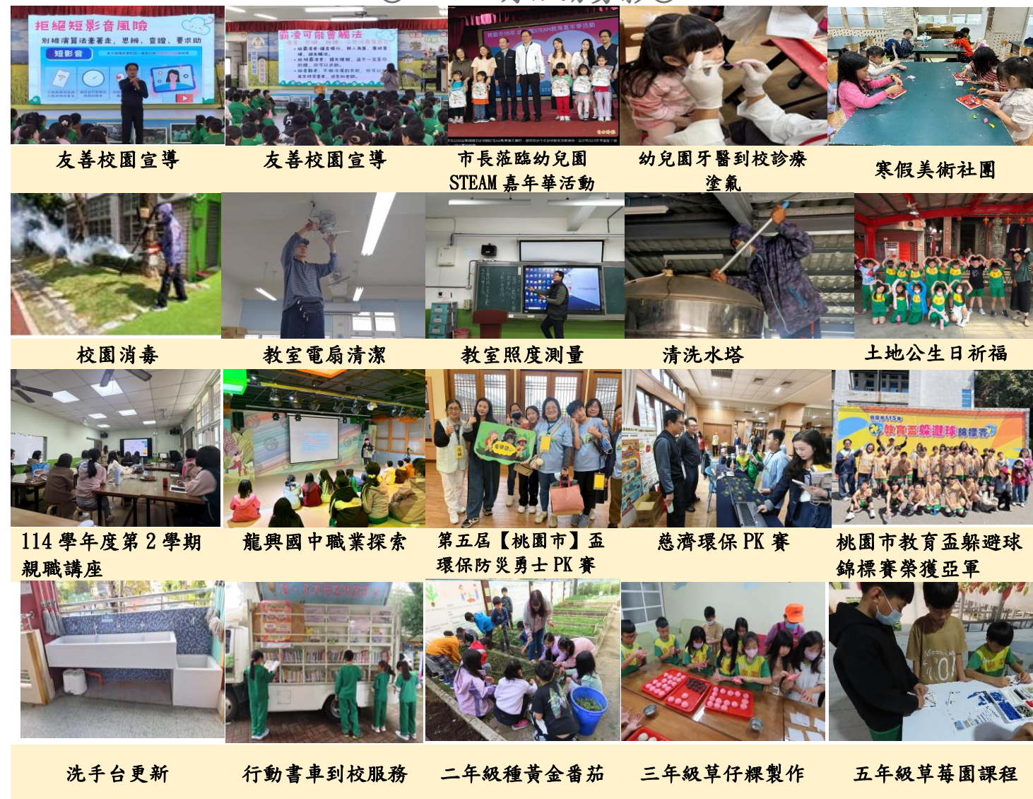
友善校園宣導 友善校園宣導 市長蒞臨幼兒園 STEAM 嘉年華活動 幼兒園牙醫到校診療 塗氣 寒假美術社團 校園消毒 教室電扇清潔 教室照度測量 清洗水塔 土地公生日祈福 114 學年度第 2 學期 親職講座 龍興國中職業探索 第五屆【桃園市】盃 環保防災勇士 PK 賽 慈濟環保 PK 賽 桃園市教育盃躲避球錦標賽榮獲亞軍