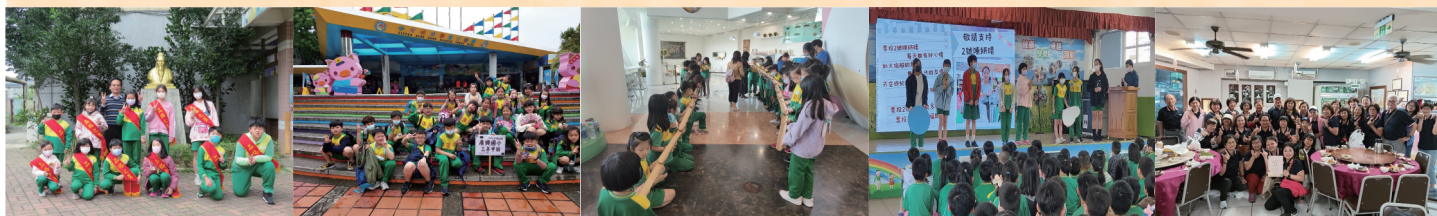
▲3、4月品格之星 ▲中高年級戶外教學 ▲小叮嚀戶外教育 ▲自治市長政見發表 ▲志工觀摩活動