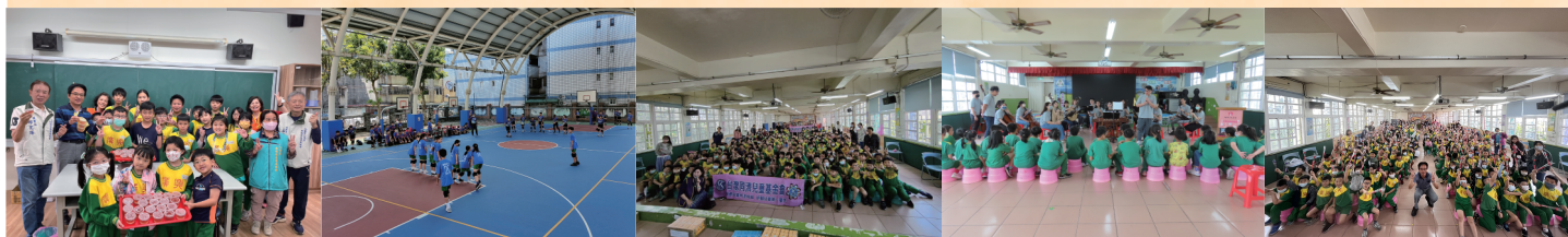
▲廣德社發協會發送點心 ▲興仁國小躲避球友誼賽 ▲同濟會電影欣賞 ▲桃園市國樂團展演 ▲母親節暨品格教育宣導