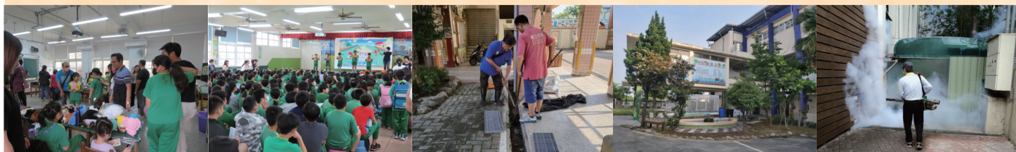
▲親職日跳蚤市場 ▲親職日廣興好品說唱 ▲水溝清淤 ▲魚菜共生池地坪改善 ▲全校室內外消毒